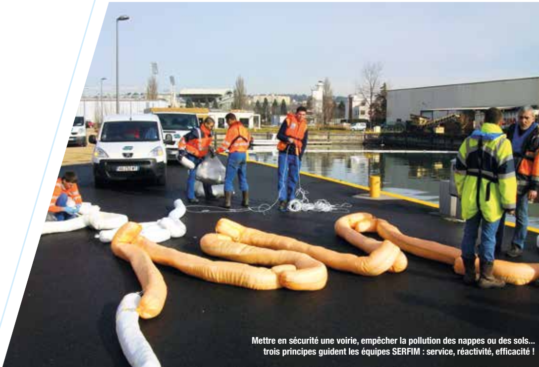
Mettre en sécurité une voirie, empêcher la pollution des nappes ou des sols... trois principes guident les équipes SERFIM : service, réactivité, efficacité !